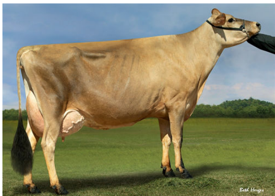
OAKLANE CHISEL DELLA 2130